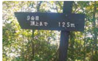
◆令和2年9月12日 遣水(やりみず)観音山(402m)登山 仏大寺から登りました 「能美市全体が俯瞰できました」