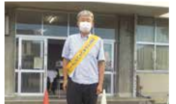
◆令和2年9月15日 7:20~8:00 能美市あいさつデー(毎月15日) 於:市内の小学校にて