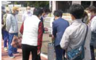
◆令和2年2月23日 てらかつ(寺井町活性化協議会) 東西連絡道路の石柱に九谷焼陶板 を設置。