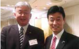
◆令和元年12月8日 西村康稔 経済再生担当大臣 (新型コロナ対策担当大臣)の研修会で 金沢市にて