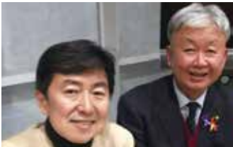
◆令和元年11月29日 笠井信輔 元民放アナウンサーと 高校の先輩の講演会で 小松市うらら小ホールにて

◆新型コロナウイルス対策で能美市は4月の補正予算に始まり、4月専決予算・6月補正予算と安全安心対策・家計対策・経済対策と3本の柱で編成し、今回の9月補正予算では新型コロナで5億8,900万余の補正を含む8億円の補正予算等を編成し、私共議会は慎重に確認した結果、全議案承認とし、9/18に閉会しました。スピード感をもっての予算の執行を求めます。