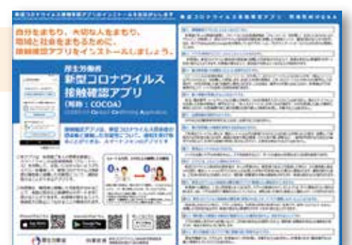
新型コロナウイルス接触確認アプリCOCOA 8月27日に登録済

質問 答え 井出敏朗 市長 ・9月補正予算を含めて5度の補正予算を編成し、安全安心対策・家計対策・経済対策の「3本の柱」をスピード感をもってきめ細かく実施した。9月補正では市民の生活への支援策・事業継続雇用を後押しする支援策を補充強化し、安全・安心そして快適に暮らせる「能美づくり」に取り組んだ。