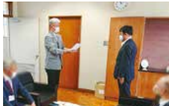
◆令和2年6月9日 寺井高校同窓会執行部メンバーで 母校へ。新型コロナウイルス感染拡大 予防のため体温計など寄贈